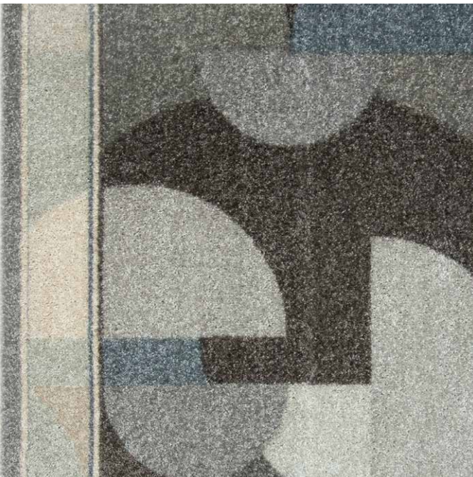
97 67cm + 80cm + 100cm

La société Associated Weavers se réserve le droit de modifier les caractéristiques de ce produit tout en conservant les mêmes qualités techniques. Il est fortement conseillé d'utiliser les coloris moyens et foncés pour les pièces à grand trafic.