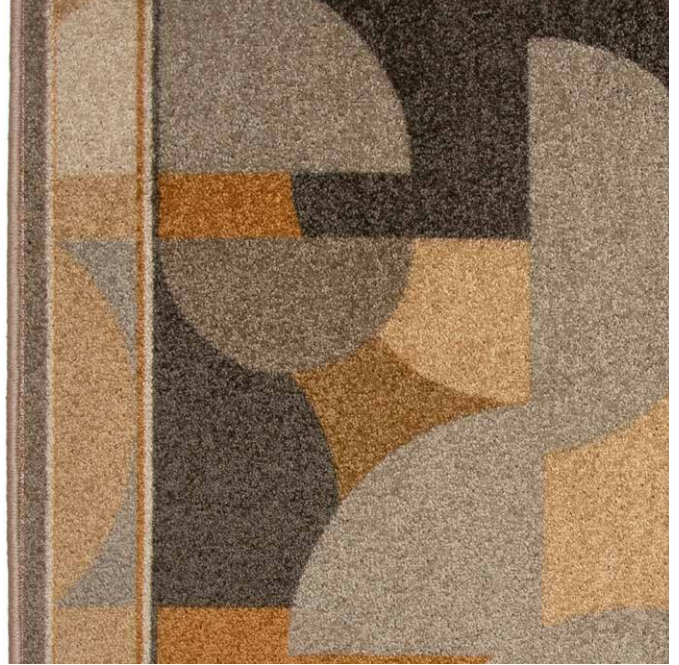
38 67cm + 80cm + 100cm