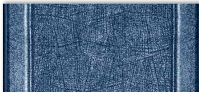
77 67cm + 80cm + 100cm