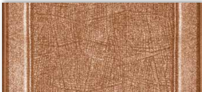
84 67cm + 80cm + 100cm