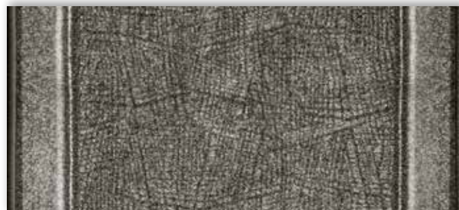
97 67cm + 80cm + 100cm