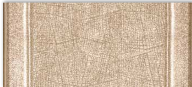
33 67cm + 80cm + 100cm