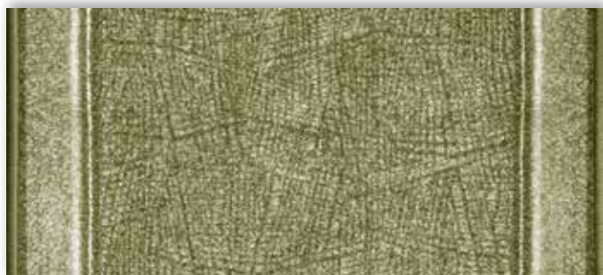
24 67cm + 80cm + 100cm