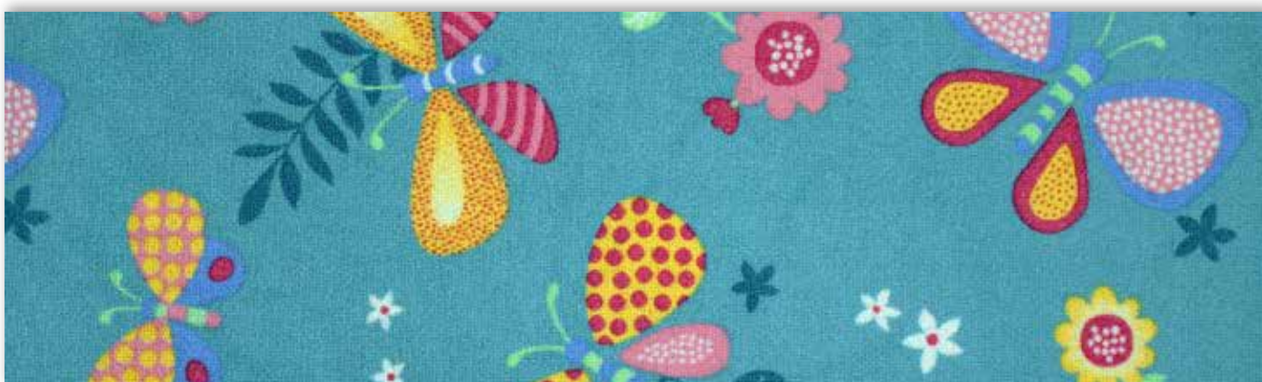
27 4m + 5m

La société Associated Weavers se réserve le droit de modifier les caractéristiques de ce produit tout en conservant les mêmes qualités techniques. Il est fortement conseillé d'utiliser les coloris moyens et foncés pour les pièces à grand trafic.