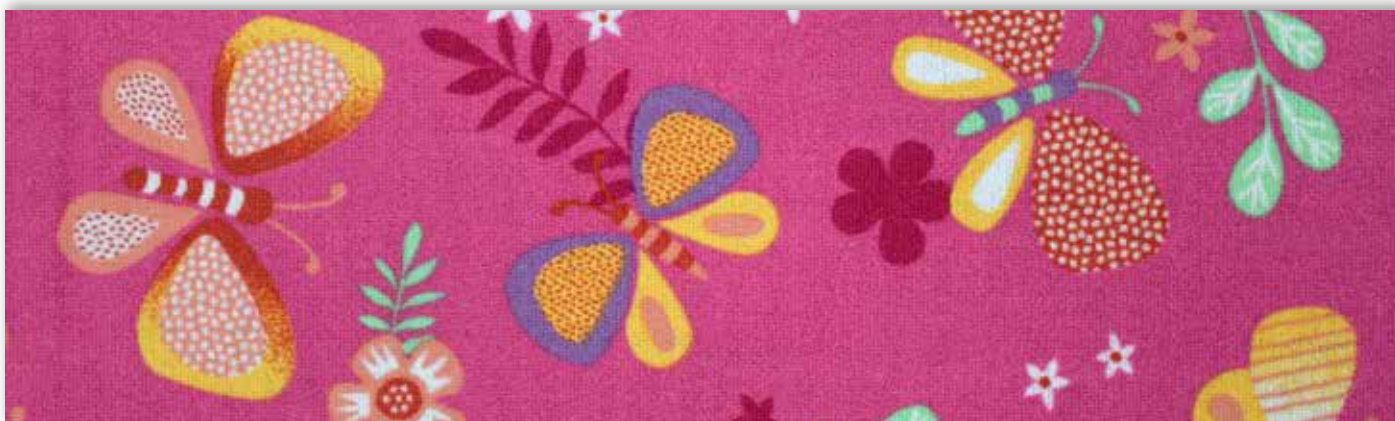
66 4m + 5m