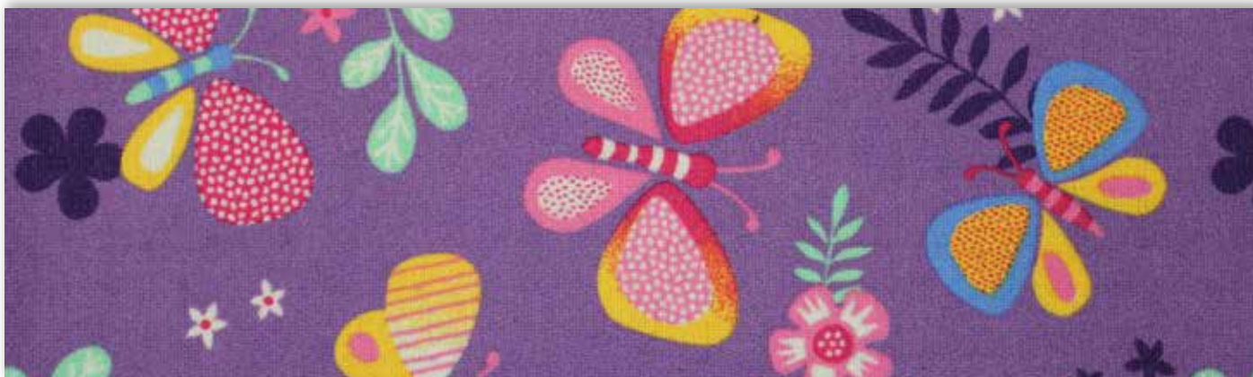
17 4m + 5m