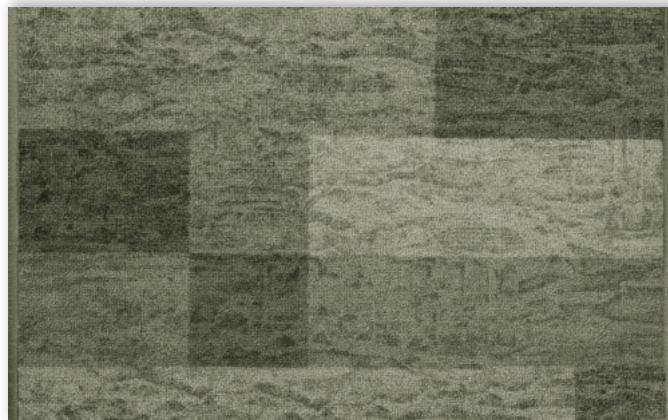
29 67cm + 80cm + 100cm + 120cm