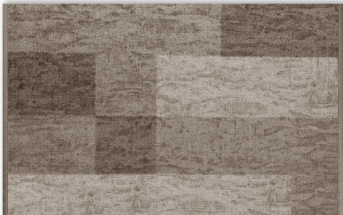
39 67cm + 80cm + 100cm + 120cm