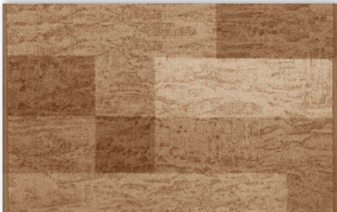
33 67cm + 80cm + 100cm + 120cm