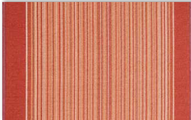
84 67cm + 80cm + 100cm