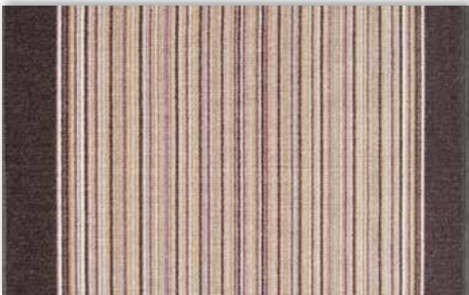
41 67cm + 80cm + 100cm