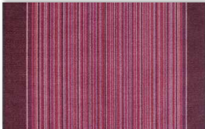
19 67cm + 80cm + 100cm