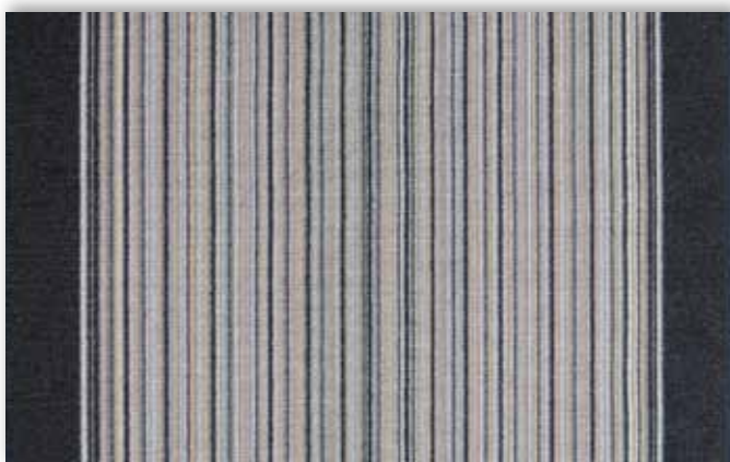
97 67cm + 80cm + 100cm

La société Associated Weavers se réserve le droit de modifier les caractéristiques de ce produit tout en conservant les mêmes qualités techniques. Il est fortement conseillé d'utiliser les coloris moyens et foncés pour les pièces à grand trafic.